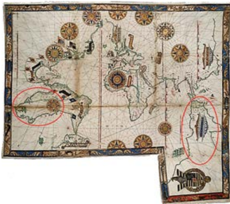
Figura 6 – Mapa de Guillaume Brouscon de Dieppe 12 , 1543 – nas elipses estão assinaladas as singularidades discutidas no texto.

Comecemos esta digressão através de um dos mapas da escola de Dieppe, de Guillaume Brouscon, datado de 1543, que se mostra na Figura 6.