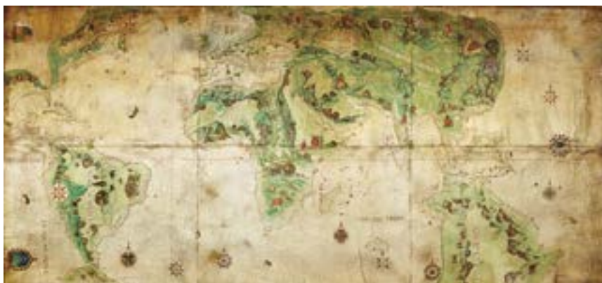
Figura 1 – Mapa dito “Delfim” ou “Harleian” (c. 1547) – um dos mapas de Dieppe que mostra “Java la Grande” – uma massa continental a sul de Java.

A questão que aqui se discute não é nova e implica uma celeuma que já vai longa em mais de dois séculos, podendo considerar-se iniciada por Alexander Dalrymple em 1786, a propósito de um dos mapas de Dieppe, designado por “Delfim” ou “Harleian” (c. 1547) representado na Figura 1, tendo então sido insinuado que, aparentemente, James Cook não teria sido o primeiro a cartografar a costa oriental da Austrália, reportando exemplos como sejam: “ Baye perdue ” para o que Cook designou “ Bay of Inlets ” ou “ Coste dangereuse ” onde o Endeavour encalhou (Dalrymple, 1786, p. 4).