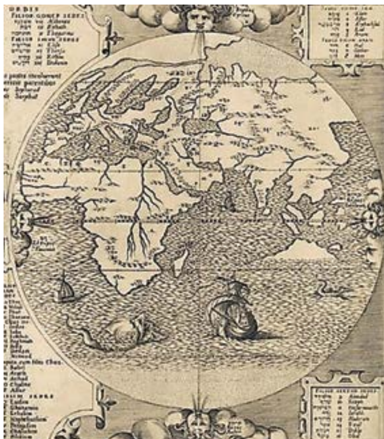
Figura 10 – Pars Orbis , hemisfério oriental, 1571/1572 – Benedictus Arias Montanus .