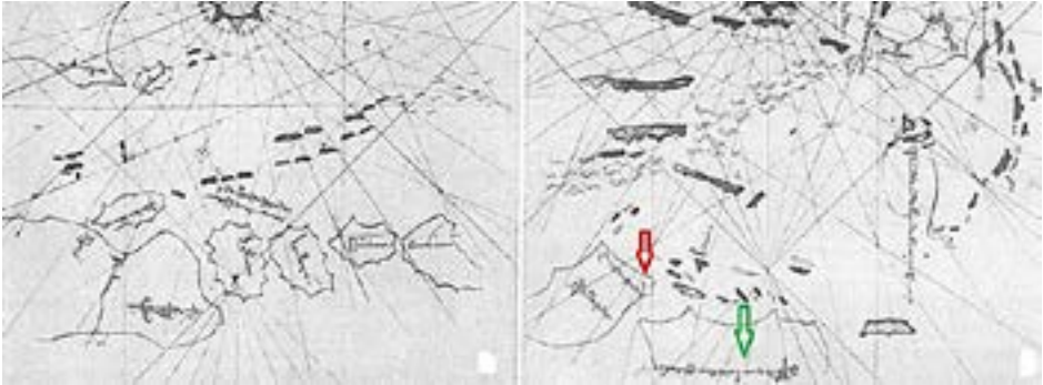
Figura 3 – Trechos de mapas do Livro de Francisco Rodrigues (c. 1513) – setas: da esquerda para a direita: Cabo de Frolles e ilha de Timor.