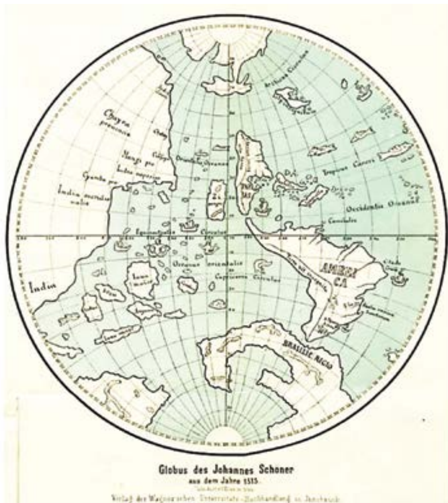
Figura 7 – Hemisfério ocidental do globo de 1515 de Johannes Schöner 16 : Brasilie Regio .

No entanto, este trata-se de um problema bem difícil de sopesar recorrendo à tradução desse texto que nos é facultada por Schüller (1915), apensa a uma cópia do original em alemão. Em primeiro lugar, esclareça-se que