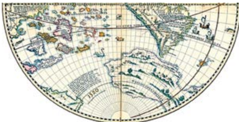
Figura 8 – Semi-hemisfério (ocidental e sul) do globo de 1520 de Johannes Schöner 26 : Brasília Inferior .

As anomalias cartográficas principais que se poderiam invocar relati- vamente a uma representação da parte ocidental do continente australiano na Figura 7 mostram-se consideravelmente corrigidas na cópia do Globo de Schöner de 1520, que se apresenta na Figura 8, aqui limitada ao semi-hemis- fério sul e ocidental.