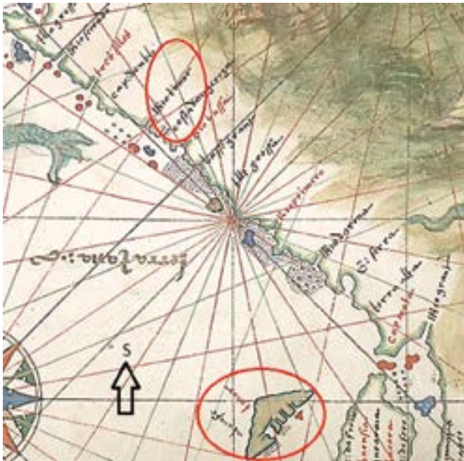
Figura 2 – Excerto de um mapa do Atlas Vallard (1547) 2 relativo à linha de costa oriental de Terra Java, orientado a sul.

É assim que nos deparamos na Figura 2 com a presença do topónimo “Rio timor” num mapa do Atlas Vallard que é frequentemente referido como representando a costa oriental da Austrália, aí designada como “Terra Java”, cuja edição remontará a 1547 conforme inscrito no frontispício – embora haja quem defenda que poderá ser anterior, ainda que posterior a 1539 (Major, 1859: xxviii) – e terá sido produzido na escola cartográfica de Dieppe na região normanda de França. Se Vallard terá sido o cartógrafo ou um proprietário é assunto não esclarecido, mas que não se afigura relevante no que sucede. Pertinente será referir a obra de Trickett (2007), onde o autor mostra uma extensa correspondência biunívoca entre sítios nomeados do Atlas Vallard e lugares compatíveis na cartografia atual da costa australiana.