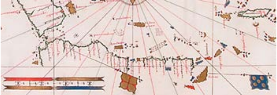
Figura 5 – Excerto sul/sudeste do mapa atribuído a Gaspar Viegas – c. 1537: costa norte de Java e ilhas adjacentes do arco da Sonda; a ilha de Timor apresenta uma bandeira com quinas.

de Java e as ilhas adjacentes do arco da Sonda, com as linhas de costa sul por desenhar – com excepção de Timor que nessa latitude aparece completamente demarcada e sinalizada com uma bandeira de quinas.