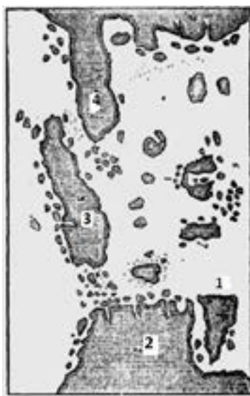
Figura 4 – Debuxo de João Afonso mostrando a região da península de Malaca a norte (4), seguindo-se a sul Samatra/Tabobana (3); Java Menor (1) que será a ilha de Sumbawa ou de Flores, embora deformada; e Java Maior (2) a sul, formada pela ilha de Java e eventualmente ilhas adjacentes do arco da Sonda, prolongadas para sul numa massa continental.