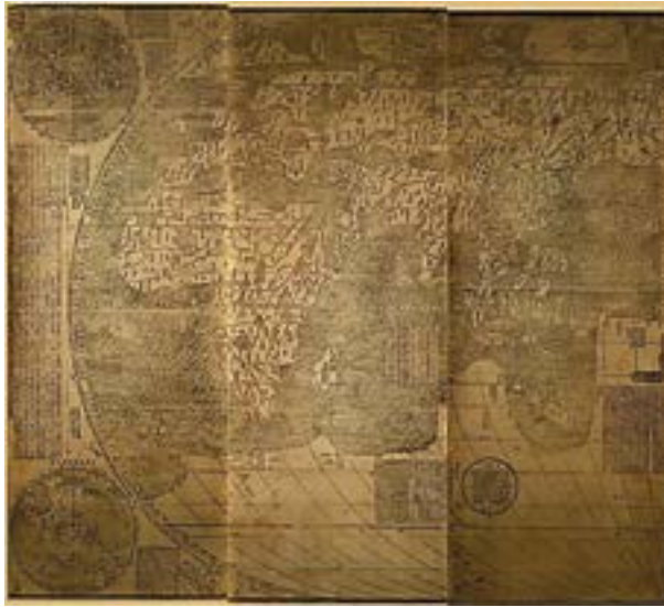
Figura 9 – Mapa Kunyu Wanguo Quantu de Matteo Ricci, 1602, 1-3.

Pelo contrário, o mapa designado Kunyu Wanguo Quantu 40 é considerado o primeiro mapa-mundo chinês inquestionável e foi encomendado ao missionário jesuíta italiano Matteo Ricci que, junto com colaboradores chineses, o produziu em 1602, gravado em painéis de madeira – e que se mostra parcialmente na Figura 9, juntando as placas 1-3.